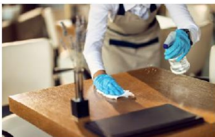
Hospedaria e Restauração