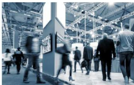
Atendimento ao público