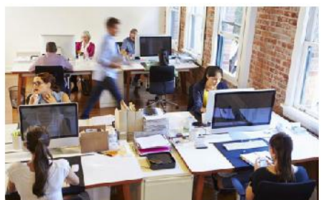
Escritórios e Call Centers

Para obter mais informações sobre os diferentes tipos de soluções e aplicativos, consulte: